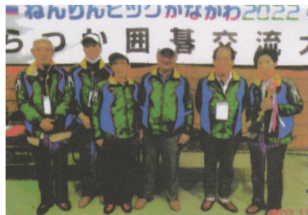
相模原あじさいチーム

昭和の男は強いぞ!! コロナに勝つ!! 病に負けない!! この健康を約束して散会しました。